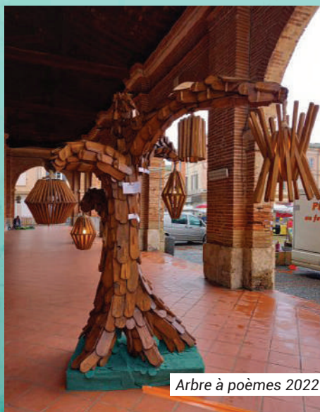
Arbre à poèmes 2022

À vos poèmes citoyens ! Vous pouvez accrocher vos poèmes ou dessins sous les arches du Musée.