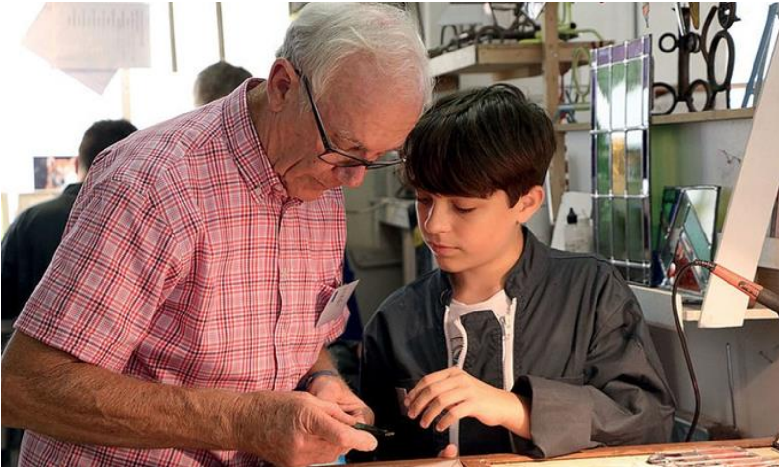
L'Outil en main Seine-Eure Le Vaudreuil