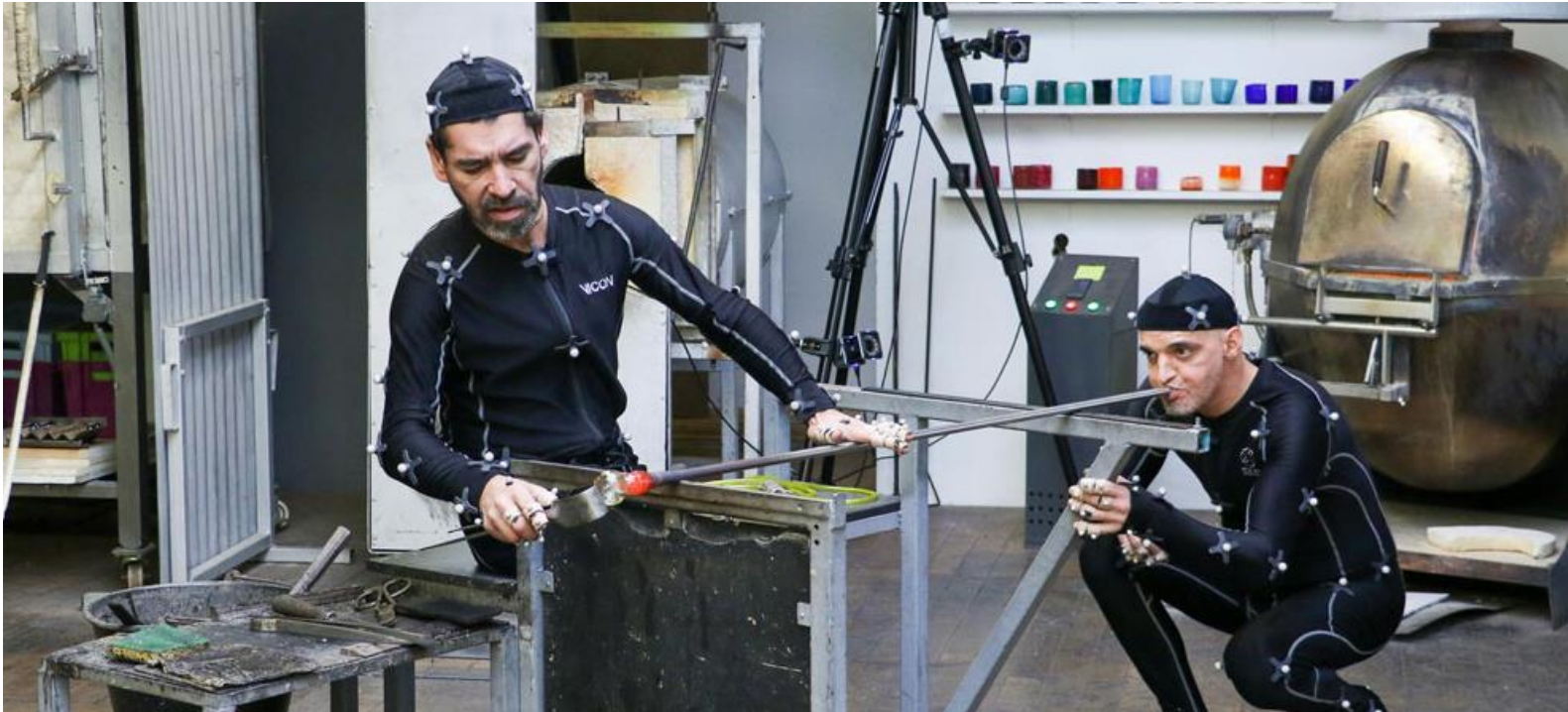
Cerfav - projet [G]host - numérisation des gestes