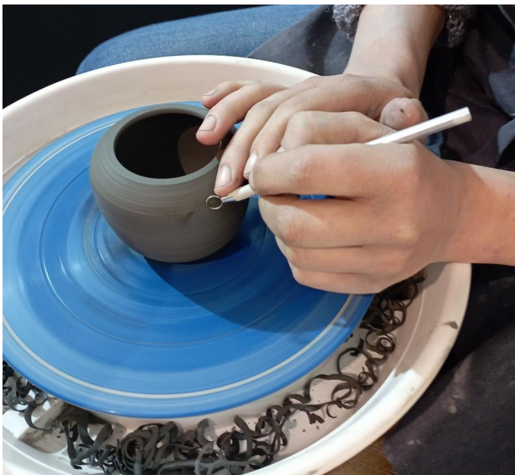
Elodie Cartier Millon céramiste salon des Baux de Provence

Installés dans les différents lieux emblématiques du vieux village, les artisans ont partagé, pendant les JEMA, leur univers à travers des ateliers d'initiation et des démonstrations à plus de 5000 visiteurs dont beaucoup de familles avec enfants, mais également de connaisseurs ou de curieux !